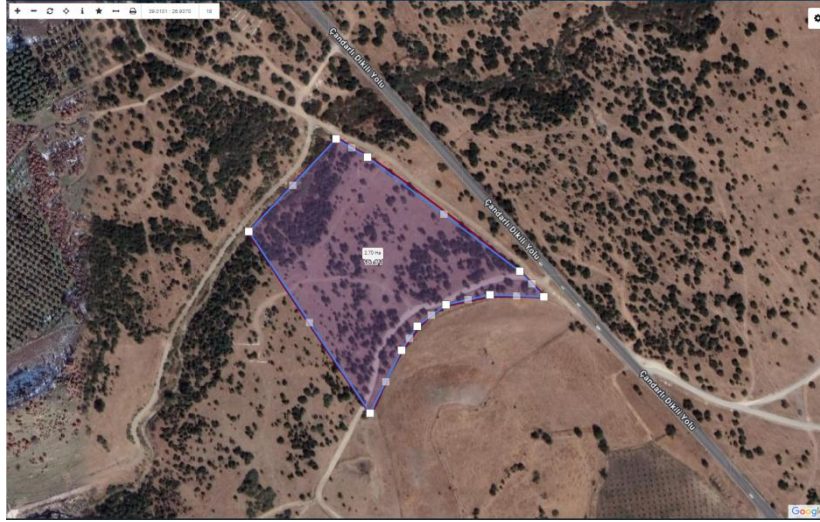
Resim 2. Dikili Belediyesi Güneş Enerji Santrali Proje Sahası

Bölgede yapılan gözlemler dahilinde ortalama sıcaklık 17.9 °C olarak ölçülmüştür. Ortalama sıcaklıklara bakılacak olursa en sıcak ay 33.3 °C ve en soğuk ay 5.8 °C olarak gözlemlenmiştir. Yine aynı gözlem periyodunda maksimum sıcaklığın 43.2 °C olduğu ve minimum sıcaklığın -8.2 °C olduğu ifade edilebilir. Ayrıca yıllık ortalama güneşlenme süresi günde 8.1 saat olmak üzere yılda 2.956,5 saattir.