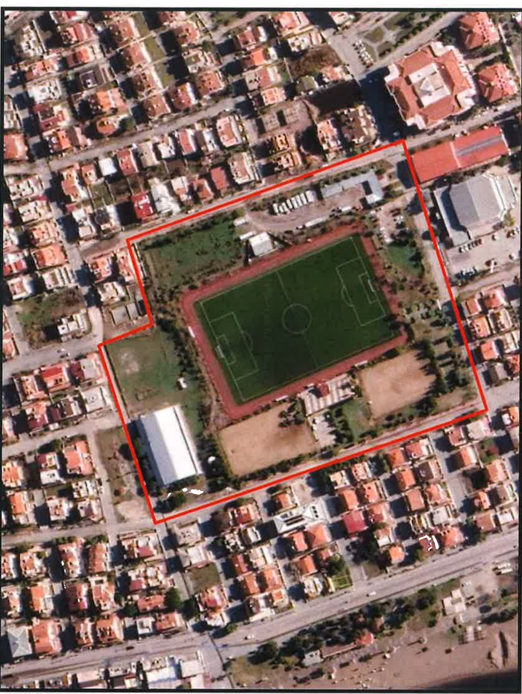
Resim 1 : İsmetpaşa Mahallesi, 41 Ada 372 Parseli gösterir uydu fotoğrafı

Söz konusu plan değişikliği; Dikili İlçesi, İsmetpaşa Mahallesi, 41 Ada 372 Parseli ( eski 41 ada 168 ve 202 nolu parseller) kapsamaktadır. Söz konusu taşınmaz mevcut durumda spor alanı olarak kullanılmakta olup içerisinde 1 adet halı saha ve 1 adet kapalı çok amaçlı spor salonu bulunmaktadır. Söz konusu taşınmaz Belediye Hizmet Binası ve Adliye Binası ile aynı sokak üzerinde bulunmaktadır. Mülkiyeti; İzmir Gençlik ve Spor İl Müdürlüğü aittir.