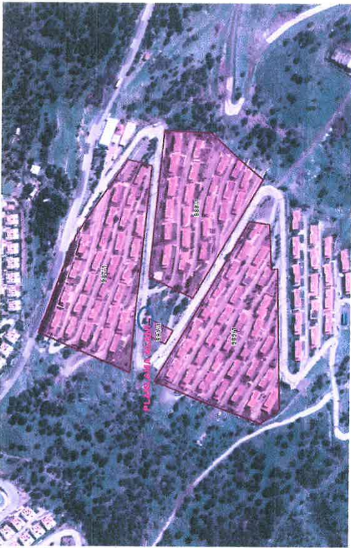
Resim 1: İmar Planı Değişikliği'ne konu alanın ve çevresinin görünümü

Hazırlanan İmar Planı Değişikliği; İzmir İli, Dikili İlçesi, Çandarlı Mahallesi sınırları içerisinde bulunan ikinci konut yapılaşma alanlarından olan Ege Mavi Kum Sitesi 987 Ada / 1 Parsel ile 991 Ada / 1 Parselin arasında bulunan köşk tipi trafo yapısının bulunduğu alanı kapsamaktadır.